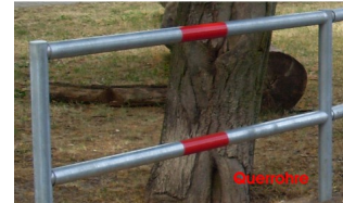
Geländer UNIVER -Querrohre-, Ref. UGV200