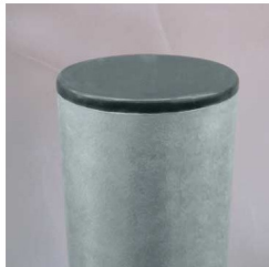
Pfosten für Tütenspender, Ref. 17641