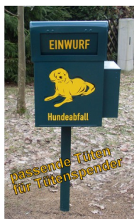
Tüten für Tütensponder HTKE, Ref. HTTUBES