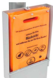
Tüten für Tütenspender HTSP, Ref. HTSP3