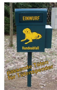
Tüten für Tütenspender HTKE, Ref. HTTUBES