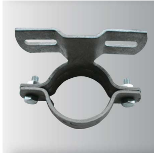
Rohrschelle, Ref. R1