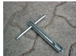
Dreikantschlüssel M10, Dreikantschlüssel Ref. DKS