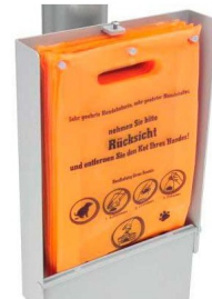
Tüten für Tütenspender HTSP, Ref. HTSP3